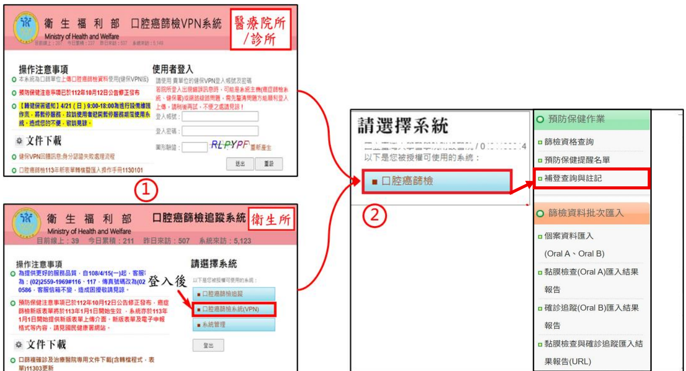
圖 1.系統登入後畫面