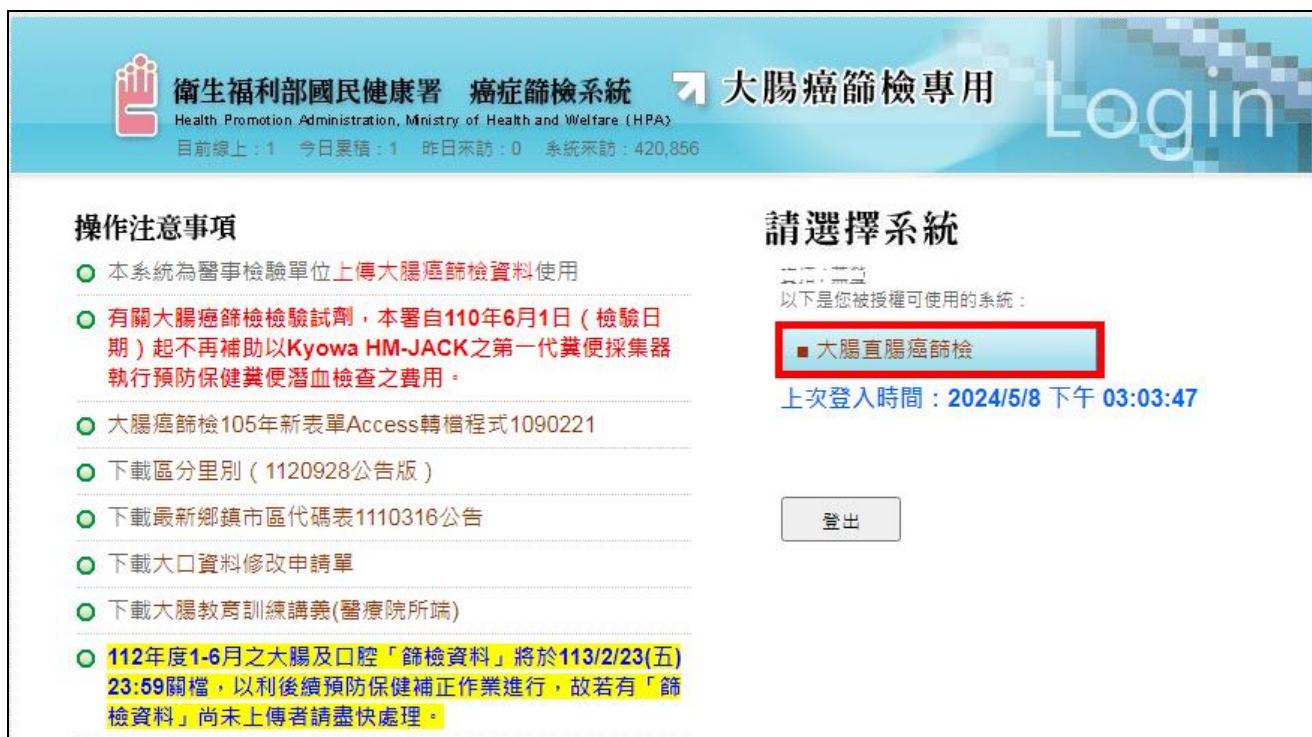
圖 2.介接至大腸癌篩檢系統後畫面