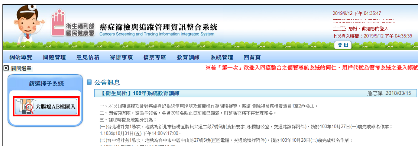
圖 1.系統登入後畫面

請於通知期限內至整合系統(原單一入口， https://pportal.hpa.gov.tw )進行帳密登入後，透過網站 右上角 或 左側 之帳號簽入介接至癌整系統，並於左方 請選擇子系統 點選「大腸癌 AB 檔匯入」後，點選「大腸直腸癌篩檢」進入到系統功能操作畫面。